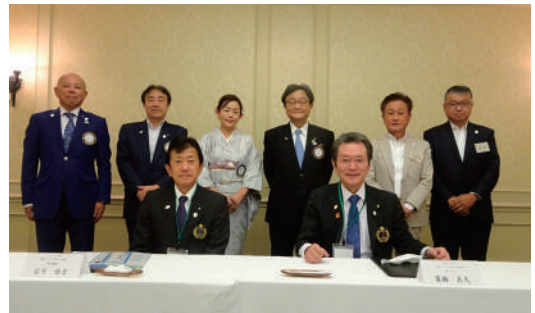
ガバナーラッピングカー 写真撮影をしました